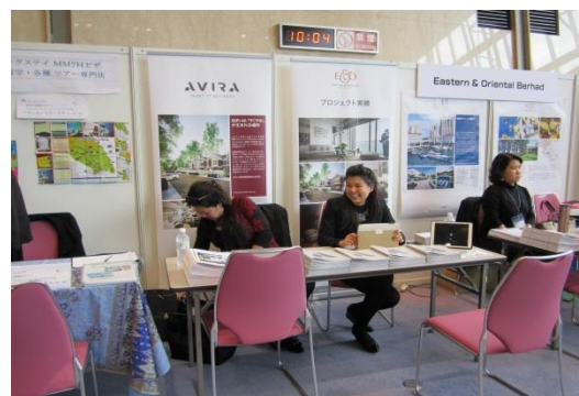
（会場内 E&O 社ブースの様子）