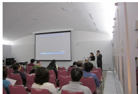
（プレミアムセミナーの様子）

*香港と深淺の経済モデルを模範に、シンガポールと一体化することにより、ジョホールを大きく発展させようとする国家経済政策